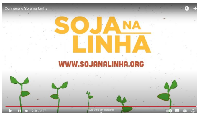
Figura 9 – Vídeo exibido sobre o Programa Soja na Linha

Após o vídeo, o Imaflora explicou em linhas gerais a Plataforma Soja na Linha, relacionando-a com a importância de realizar um bom monitoramento, verificação e reporte. Essa importância pode estar relacionada tanto a acordos setoriais, como foi a Moratória da Soja, como a exigências da demanda e compromissos individuais.