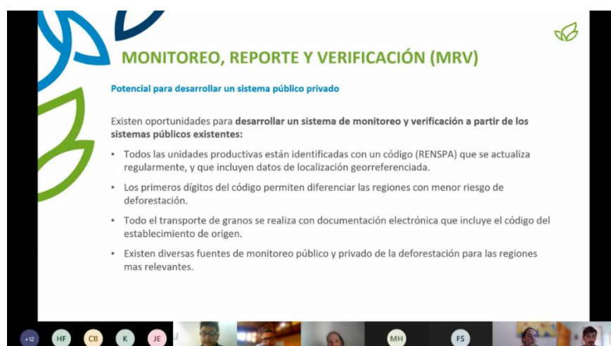
Figura 8 – Oportunidades de desenvolvimento de um sistema de monitoramento e

Com a finalização da contextualização do monitoramento, reporte e verificação na Argentina, reservou-se um momento para que as empresas pudessem comentar suas experiências em relação ao tema na sua cadeia de fornecimento de soja. Neste momento, algumas empresas se dispuseram a comentar suas experiências em relação ao tema, entre elas Cargill e Proforest. Os pontos colocados serão apresentados mais adiante neste relatório, na seção Principais Comentários e Sugestões.