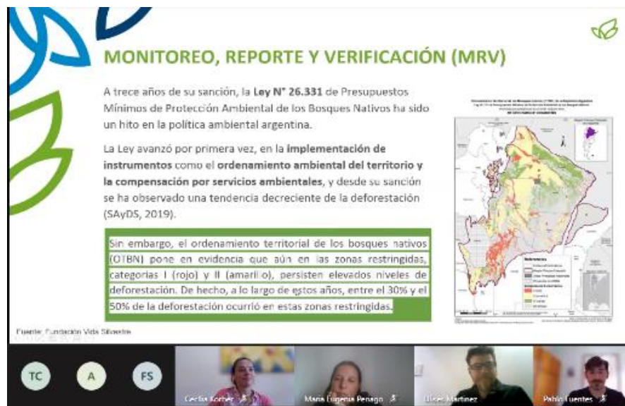
Figura 6 – Monitoramento, Reporte e Verificação na Argentina (contexto legal)