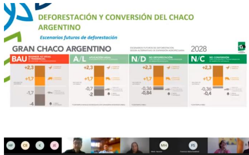
Figura 4 – Estudo de Tendências em relação

de efeito estufa, manutenção de serviços ecossistêmicos e da biodiversidade. Conforme há um recrudescimento do conceito de desmatamento e conversão, indo desde o desmatamento legal até desmatamento e conversão zero, há um maior aumento da manutenção da biodiversidade e redução das emissões 1 .