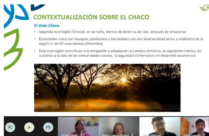
Figura 3 – Contextualização do Chaco

Na sequência, a FVS abordou um panorama geral do contexto de desmatamento e conversão no Gran Chaco Argentino nos últimos 45 anos, apresentando: