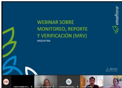
Figura 1 – Abertura do Webinar