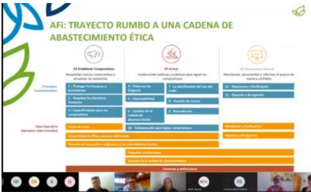
Figura 5 – Apresentação do AFI