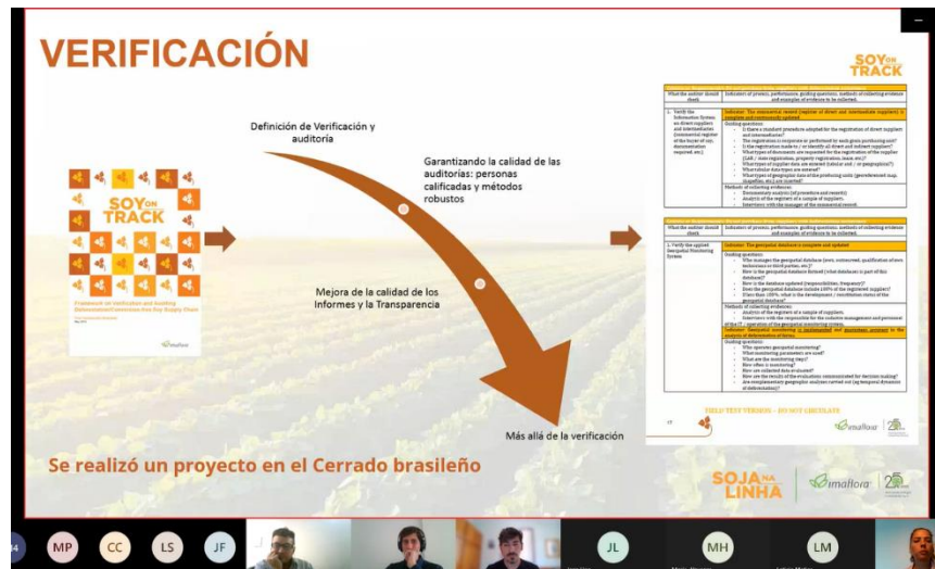
Figura 10 – Quatro passos descritos no Protocolo da Soja na Linha