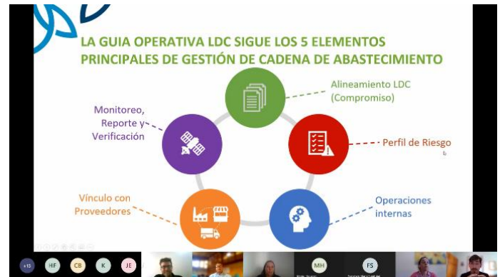
Figura 6 – Os elementos para a aplicação do AFI

Após a apresentação do Accountability Framework (AFi) e o Guia Operacional Livre de Desmatamento e Conversão, TNC apresentou o cenário atual do monitoramento, reporte e verificação na Argentina, mencionando o progresso e os desafios existentes.